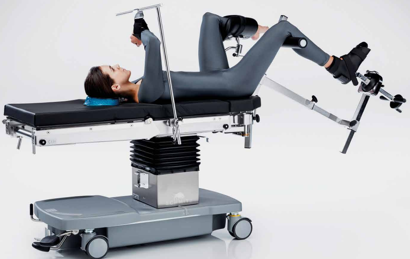
Fracturas de la pierna inferior