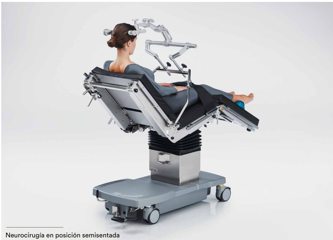
Neurocirugía en posición semisentada