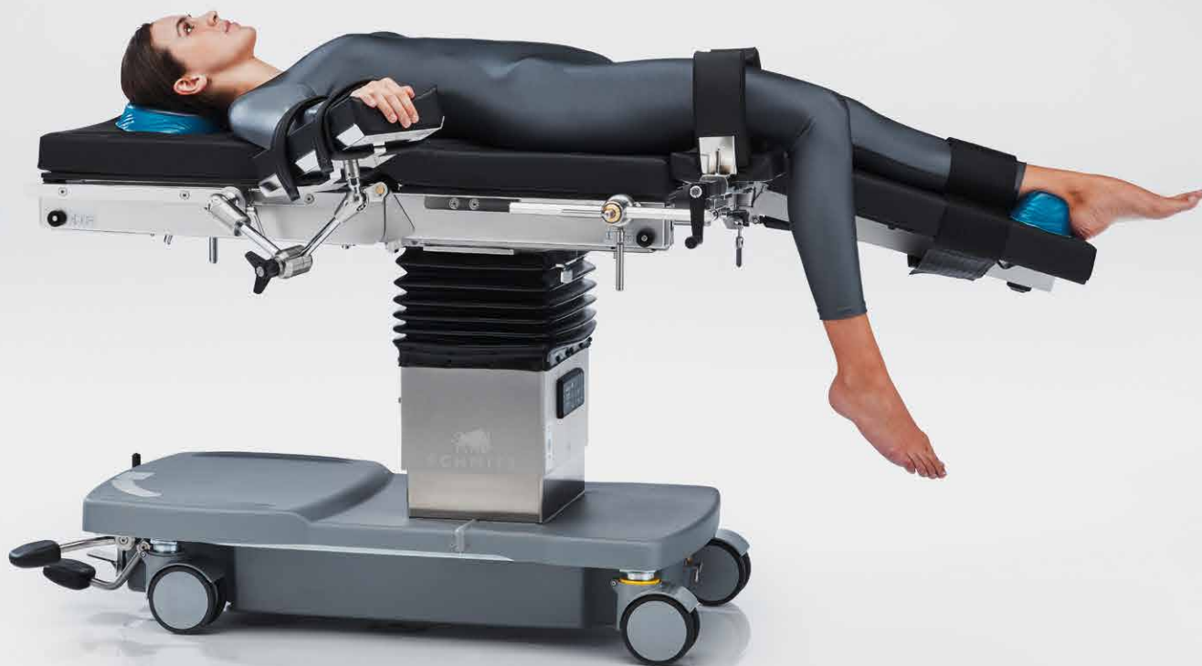
Artroscopia de rodilla