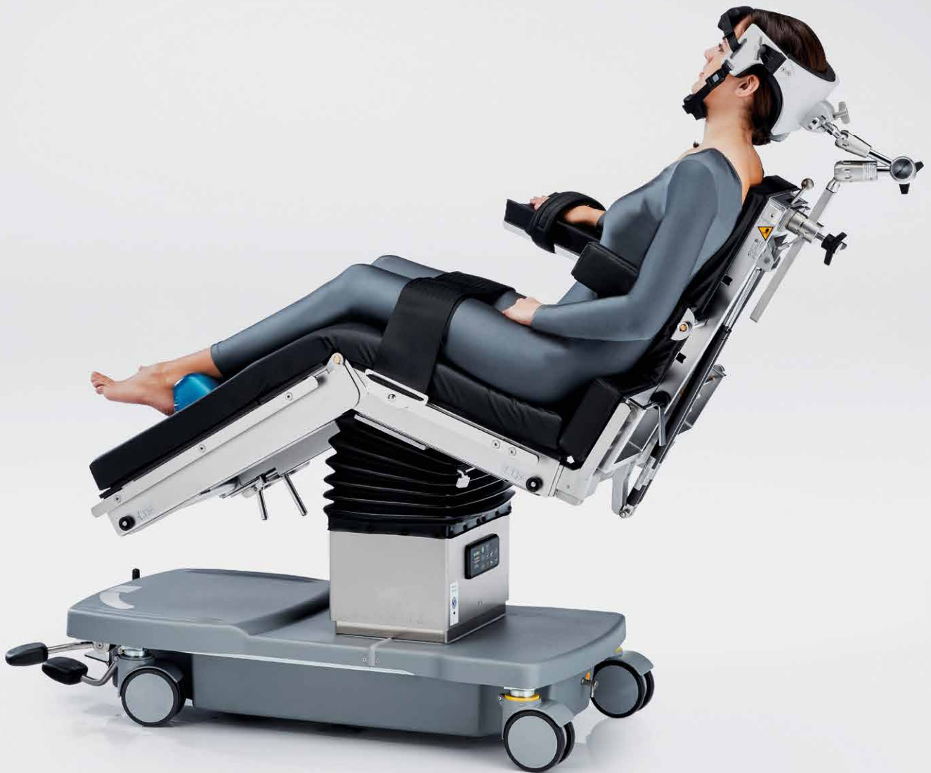
Cirugía de hombro