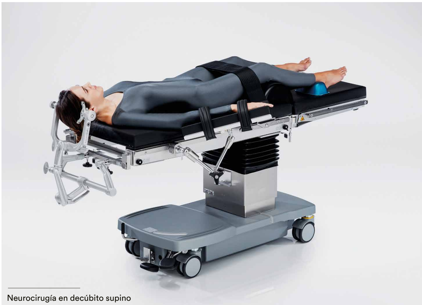
Neurocirugía en decúbito supino