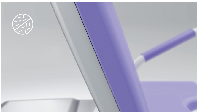
7. Antimikrobielle Lackierung und Polster