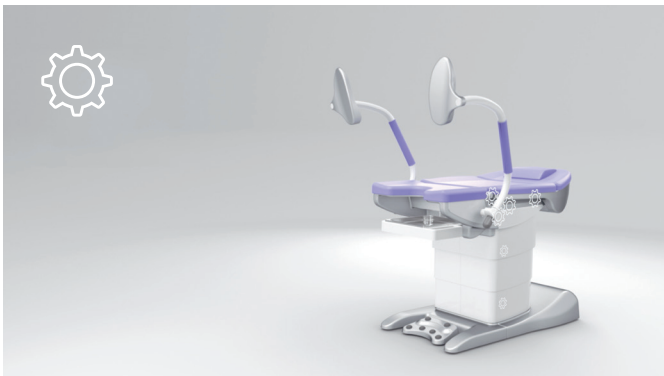
5. Simultan koordinierte Bewegungsabläufe