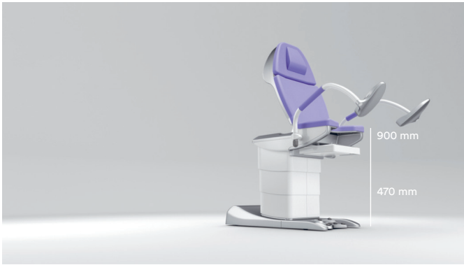
1. Einzigartig in der Höhenverstellung