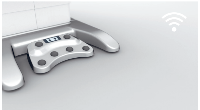
6. Steuerung via Wireless Technologie