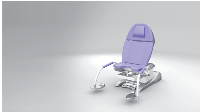
2. Komfortable Ausgangsposition setzt neue Maßstäbe