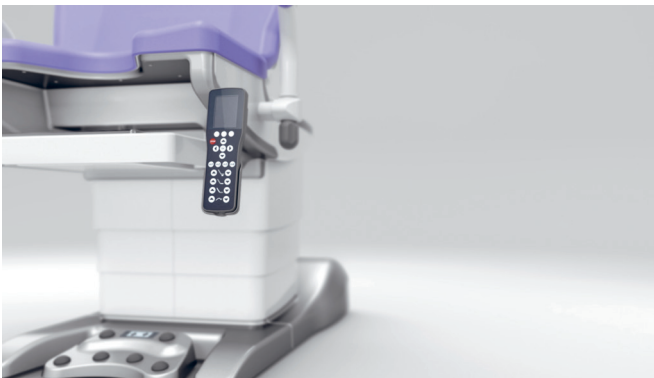
13. Handbedienung mit Display und schwenkbarer Halterung