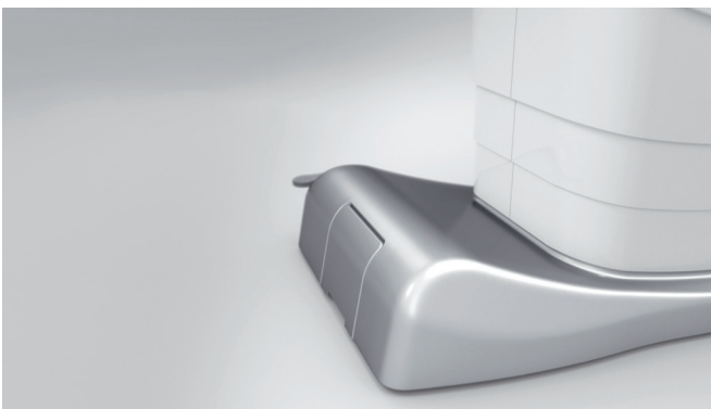
15. Máxima resistencia gracias a un acabado con los materiales de plástico ABS más modernos