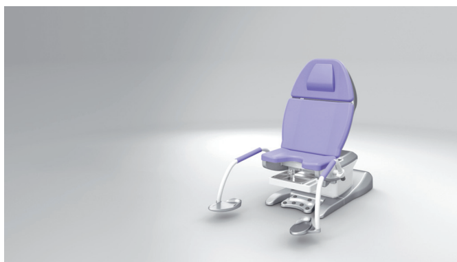
2. Su cómoda posición inicial establece nuevos estándares