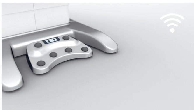
6. Control mediante tecnología inalámbrica