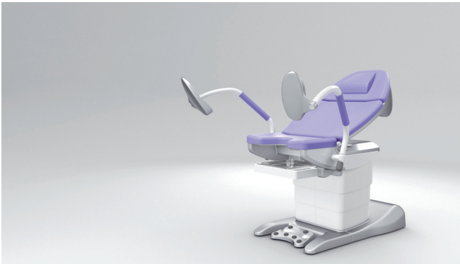
11. Función de memoria: numerosas posiciones individuales de reconocimiento que se pueden guardar