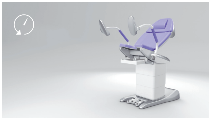
4. Tecnología puntera de accionamiento que ahorra tiempo