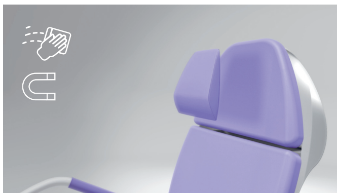
8. Sujeción magnética higiénica y muy sencilla del cojín para cabeza