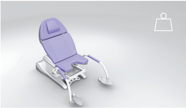
9. Gran carga de trabajo segura de 300 kg