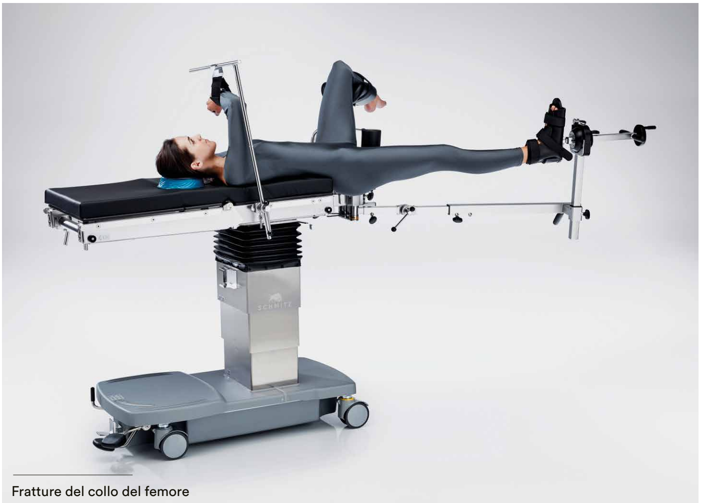
Fratture del collo del femore