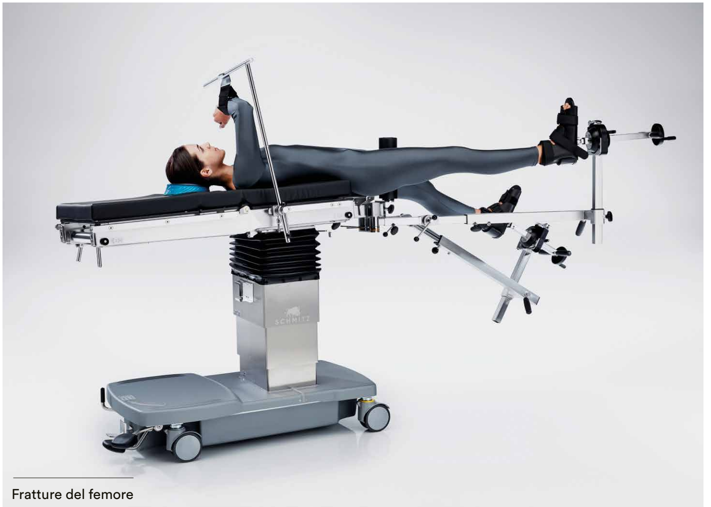
Fratture del femore