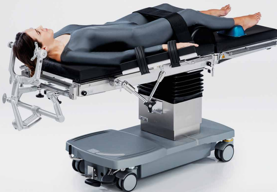
Neurochirurgia in posizione supina