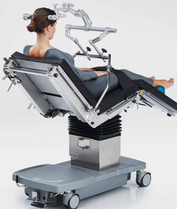
Neurochirurgia in posizione semiseduta