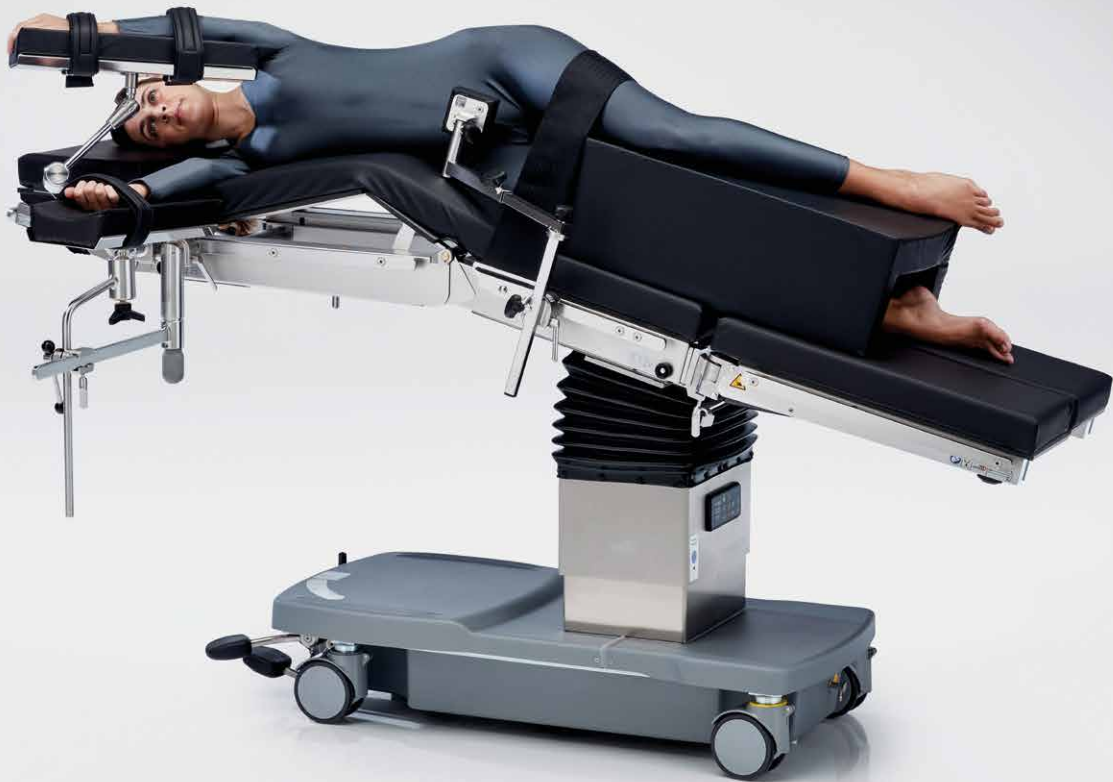
Posizione su un fianco