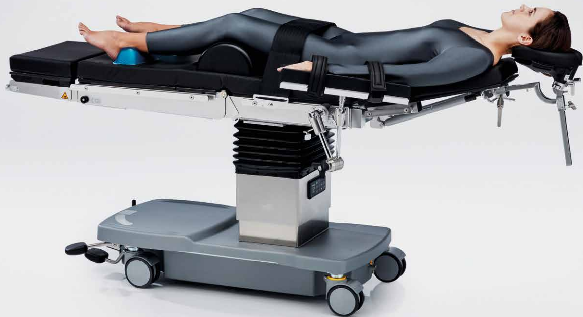
ORL, Chirurgie maxillofaciale, Ophtalmologie