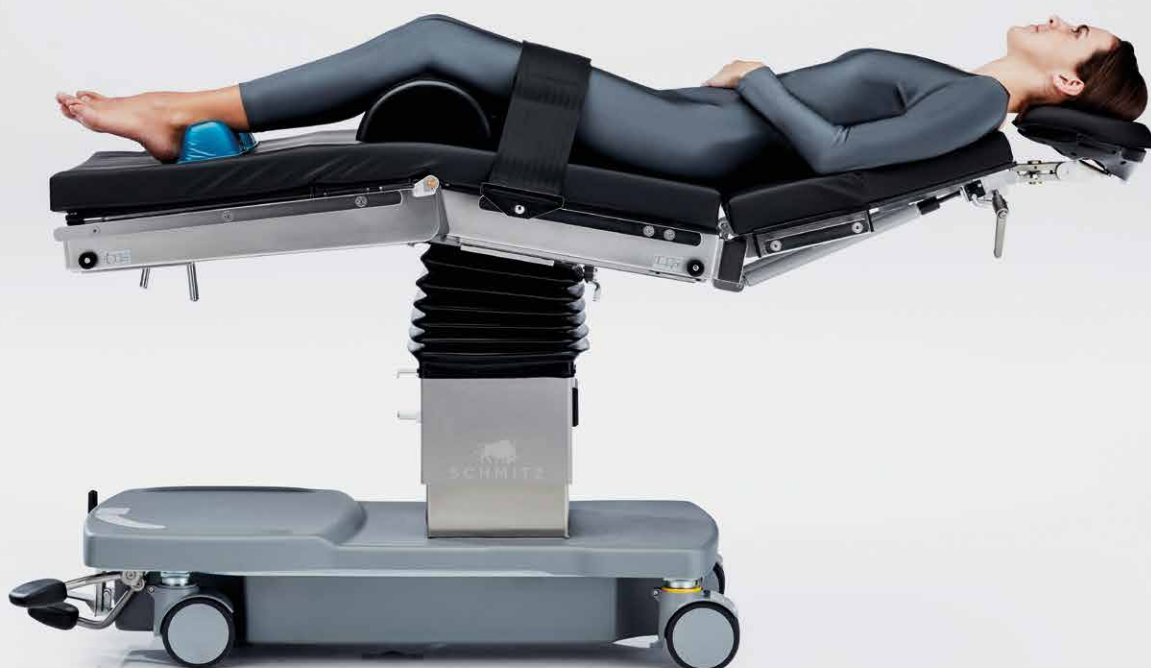
Chirurgie maxillofaciale, Ophtalmologie